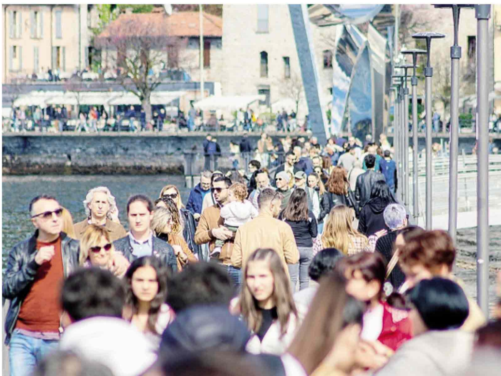
Folla di turisti ieri sulla diga foranea di Como