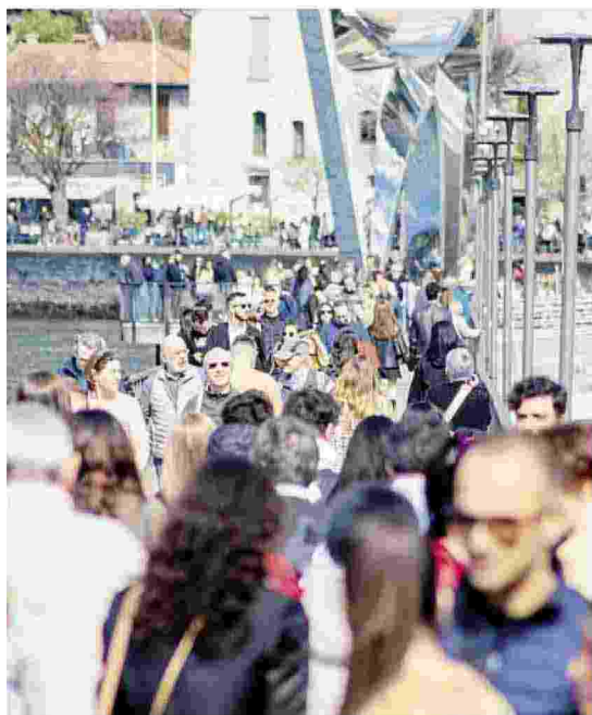
Folla ieri sulla diga fornea BUTTI